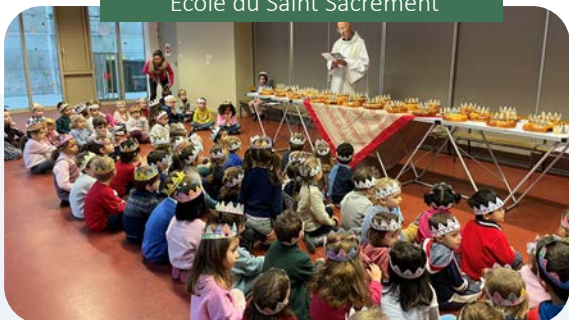
École du Saint Sacrement