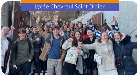
Lycée Chevrel Saint Didier